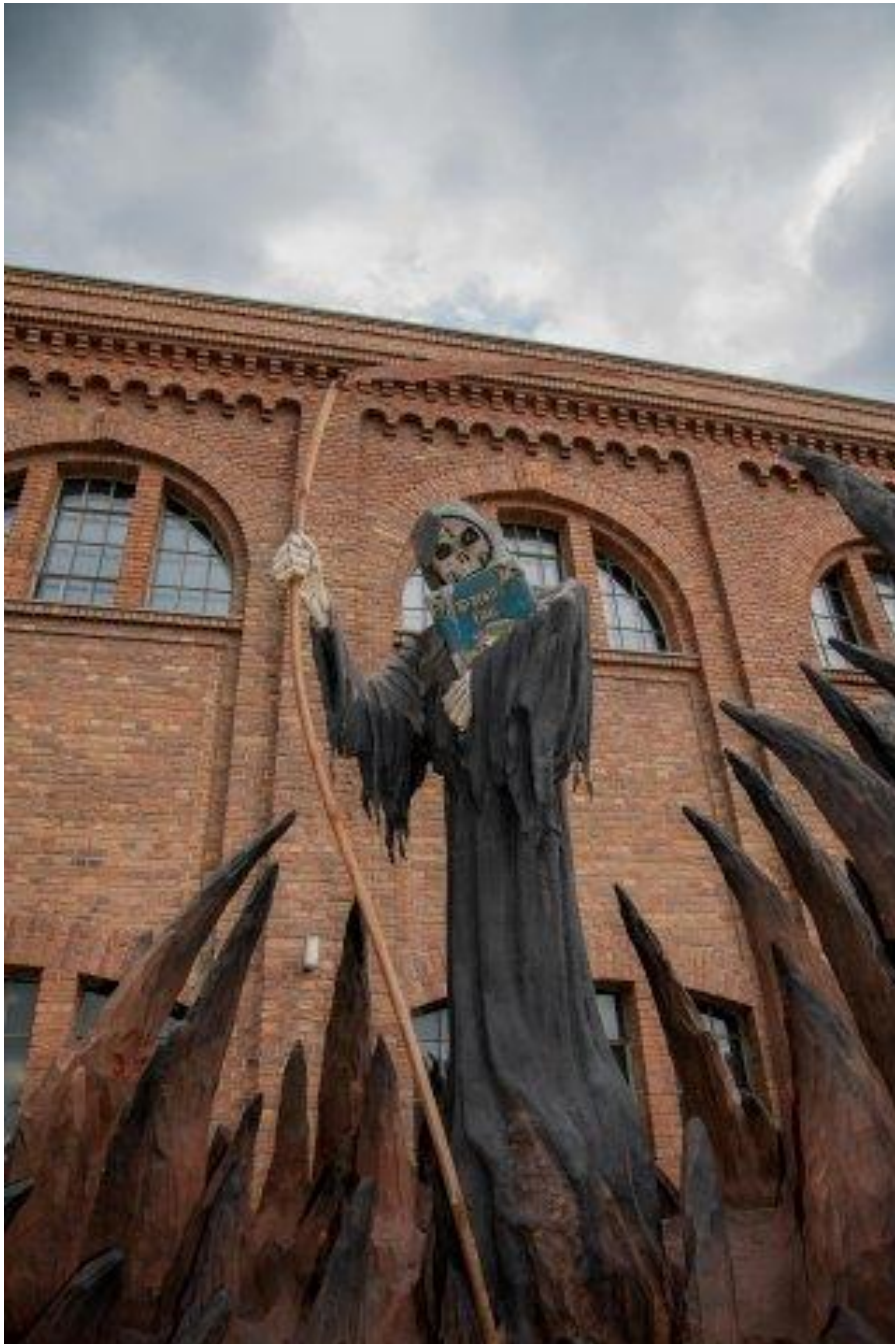
Das Grusellabyrinth in Bottrop hat einen neuen Namen und neue Attraktionen. (Archivbild)

„Jedoch ist jedes Ende auch ein Neuanfang“, heißt es in dem Clip. Dann erscheint der Name ELORIA in großen Buchstaben auf dem Bildschirm! Das Grusellabyrinth NRW hat seit seiner Insolvenz Anfang 2020 einen neuen Besitzer und nun auch einen neuen Namen und ein neues Konzept.