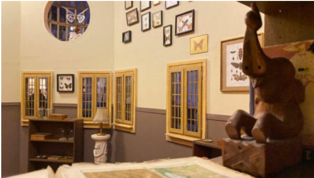
Die Kulissen in "EXPLORIA" sind voller Details.

„EXPLORIA Shoot“ startet knapp zwei Wochen später am 19. Mai 2022 . Der Einlass kostet 19 Euro pro Person und findet alle zehn Minuten statt. Die maximale Aufenthaltszeit beträgt rund zwei Stunden. Kinder bis sechs Jahre müssen keinen Eintritt zahlen. Weitere Gelegenheiten für die Fotoshootings ergeben sich am 22. Mai sowie am 9., 10., 17. und 19. Juni.