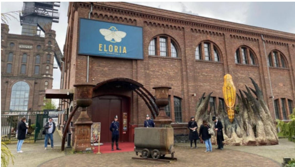
"EXPLORIA" ist ein langer Straßenzug mit vielen detaillierten Kulissen und Gebäuden.

Der Straßenzug mit den begehbaren Gebäuden wurde bewusst zu den 1920er Jahren gestaltet, da das Jahrzehnt zwar weit genug vom Alltag entfernt ist, aber dennoch wenige Hürden für Kostüme bei den Partys sowie dem Live Action Role Playing bietet. Dass die Epoche massentauglich ist, zeige laut den Betreibern zudem der Erfolg der Serie „Babylon Berlin“.