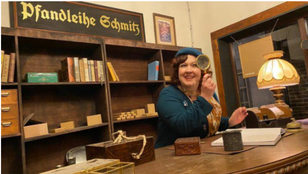
LARP lebt durch die Interaktionen zwischen den Teilnehmern.

Alltag entführen. Vor Beginn der Events finden Workshops statt, zudem wechselt regelmäßig das Programm.