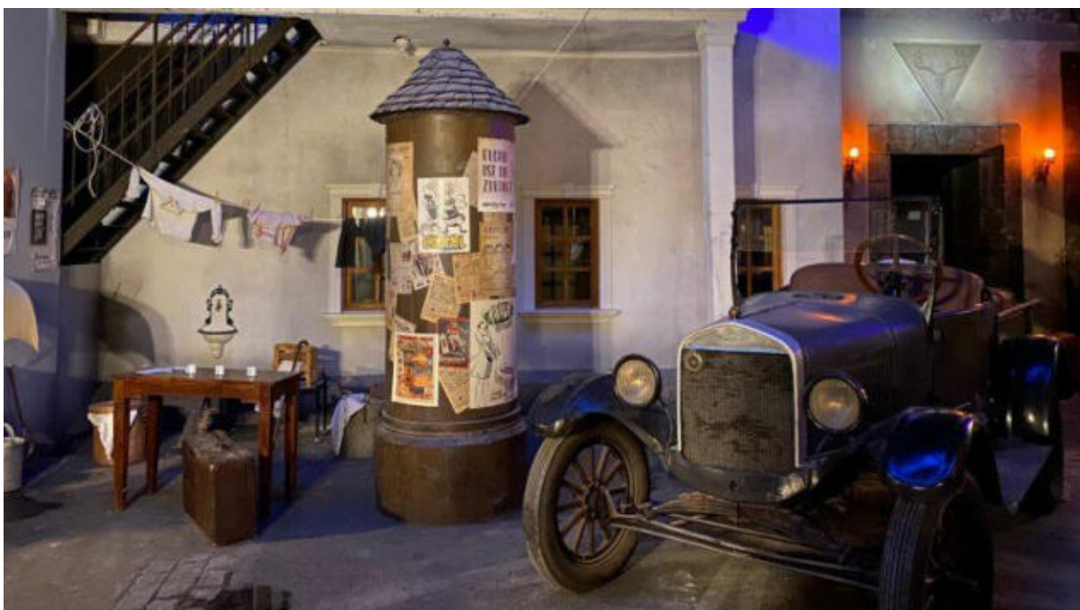
Der Marktplatz der Stadt eignet sich für schöne Fotos.

Unter dem Namen „ EXPLORIA Shoot “ nutzt die ELORIA Erlebnisfabrik die detaillierte Kulisse der Stadt auch als Fototrail. An mehreren Tagen im Monat können Besucher hier an mehr als zehn Fotopunkten ihr perfektes Instagram-Foto oder TikTok-Video erstellen. Bereitgestellt werden auch eine Beauty-Station zum Schminken und eine kleine Umkleidekabine.