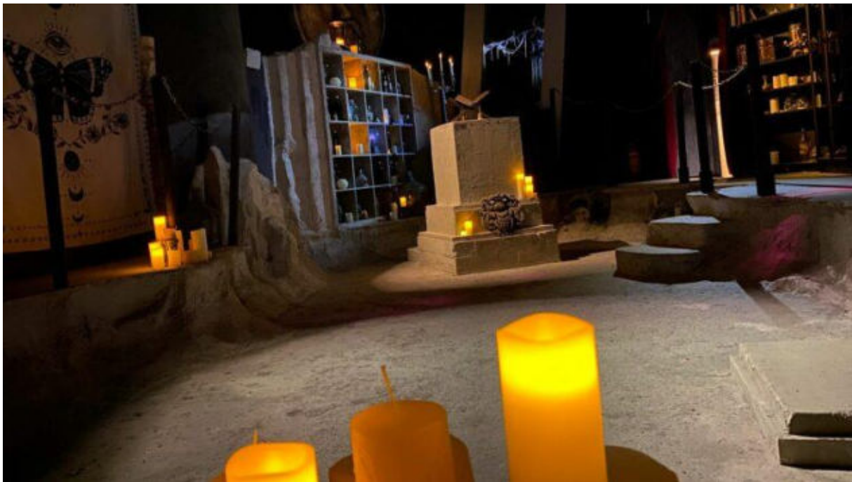
Im Untergrund der Stadt warten mysteriöse Rätsel.

Unter dem Namen „EXPLORIA Game“ nutzt die ELORIA Erlebnisfabrik die nachgebaute Stadt als Escape Room, der von zehn bis 300 Spielern gleichzeitig bespielt werden kann. Auf über 1.600 Quadratmetern warten zahlreiche Rätsel und Geheimnisse, die gelöst und gelüftet werden wollen. Spieler können hier zwischen verschiedenen Aufgaben wählen.