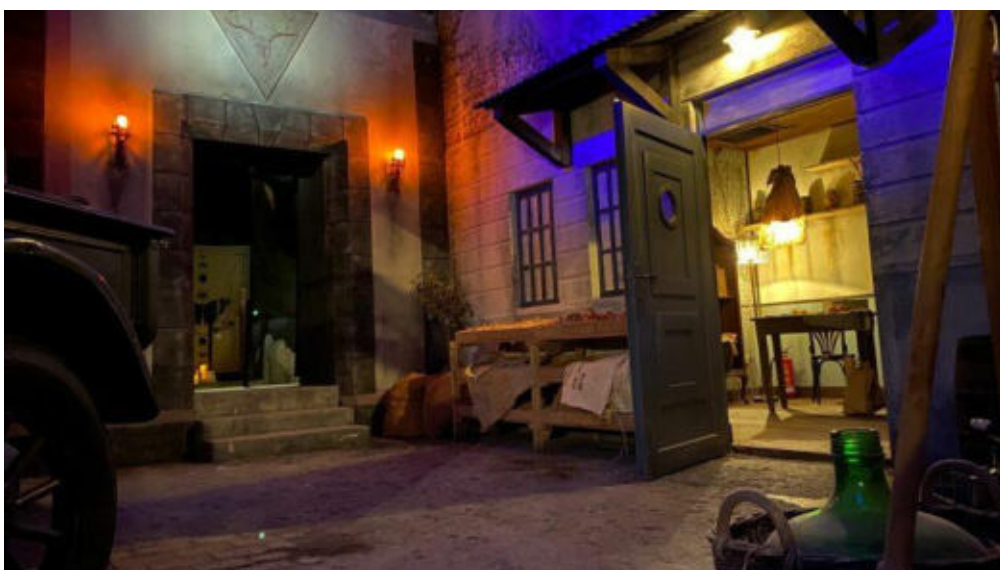
Der Zugang zum Untergrund der Stadt ist unscheinbar.

Zu erwerben sind für „EXPLORIA Game“ sowohl Zeittickets, mit denen Gäste innerhalb einer festgelegten Zeit verschiedenste Quests und Geschichten erleben können, als auch Missionstickets, mit denen „EXPLORIA“ auf einer festgelegten Mission entdeckt wird. Die Missionen werden sich in Dauer, Schwierigkeit und Thematik voneinander unterscheiden.