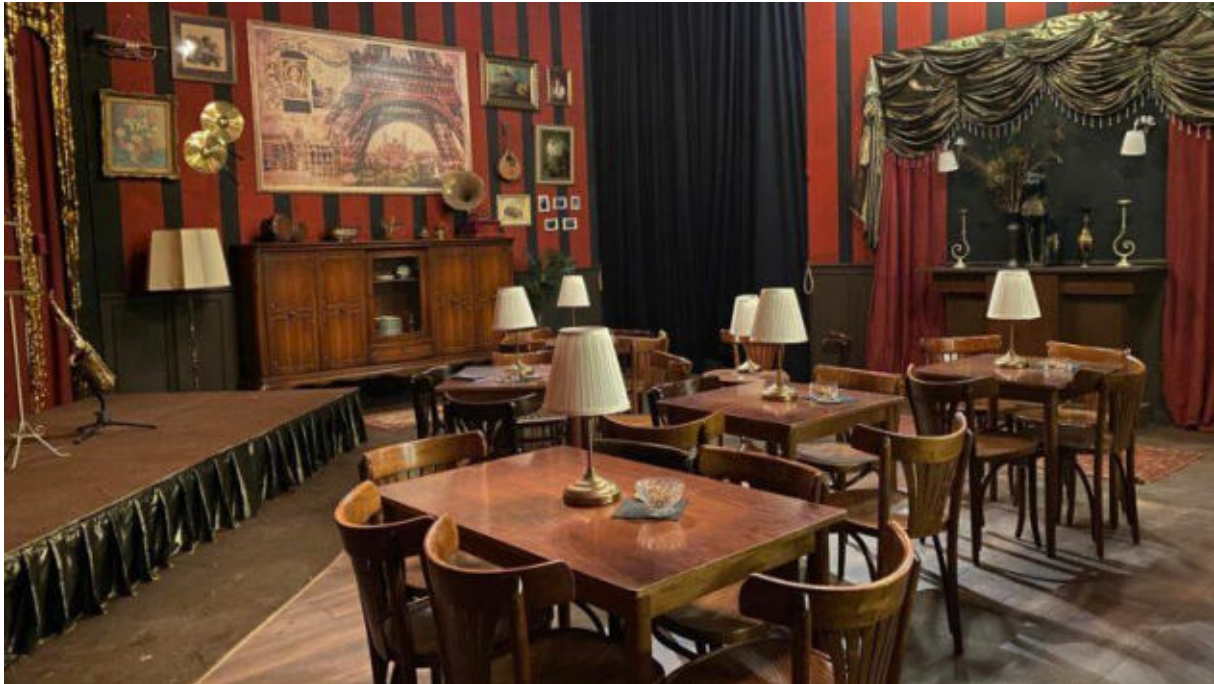
Die Flüsterbar der Stadt ist der perfekte Ort für Partys.

Nicht zuletzt bietet die ELORIA Erlebnisfabrik unter dem Namen „ EXPLORIA Party “ einmal pro Quartal auch Partys inmitten der Stadtszenerie an. Zu dem mondänen Unterhaltungsprogramm tragen Live-Bands und Tänzer bei. Der Eintritt wird nur mit einem zu den 1920er Jahren passenden Kostüm gestattet. Insgesamt bietet die Kulisse Platz für 300 Gäste.